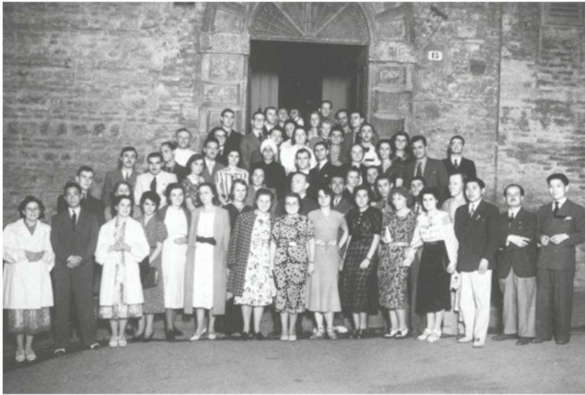
5 agosto 1938 – Gli studenti di 29 nazionalità con i giornalisti di Perugia

temeva, da una parte, che gli studenti potessero diventare una quinta colonna interna dei sommovimenti politici che avvenivano a livello internazionale; dall'altra, che si creassero alleanze con gli ambienti della sinistra radicale italiana, contribuendo a rendere le contestazioni ulteriormente difficili da gestire e controllare. Il dialogo tra l'archivio e le testimonianze dirette risulta quindi fondamentale per ricostruire una storia sociale della presenza degli studenti stranieri in Italia, e produrre uno sguardo alternativo con cui approcciarsi alle complessità dell'antimperialismo e del terzomondismo italiano nei long global sixties .